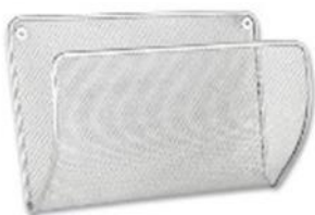
„MESH“ Zeitschriftenordner aus Metall